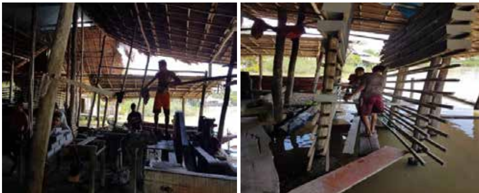
Figura 3 – Trabalho oleiro na comunidade do rio Ajuai.

Para melhor compreensão do trabalho oleiro, é necessário apresentar as etapas da produção do tijolo. Assim sendo, a atividade inicia com a busca da matéria-prima e a extração de argila, sendo realizada por oleiros através de mergulhos ou retirada das margens dos rios. Já no interior da olaria, a argila é colocada no maromba, que é empurrado com as mãos e pés dos ribeirinhos. No maromba, a argila adquire o molde de tijolos contínuos, que são cortados com fios de nylon, por oleiros que acompanham o processo trajando camiseta, bermuda e pés descalços. Os tijolos são, depois, secados e levados ao forno com temperaturas elevadas para cozimento. Posteriormente, são organizados nas prateleiras enquanto aguardam o transporte (Figura 3).